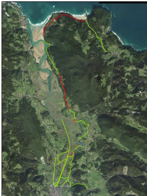
— Itinerario acondicionado — Itinerario sin acondicionar — Itinerario en ejecución