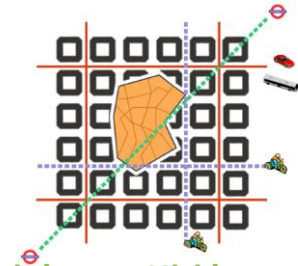
Hiri trinkoa vs Hiri lausoa